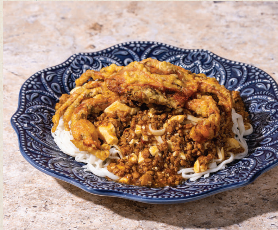
讚 軟殼蟹麻婆豆腐撈麵 Soft Shell Crab Ma Po Tofu Noodles