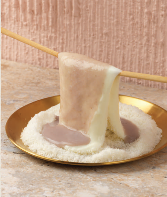
芋泥椰絲奶奶麻糬 Taro Coconut Milk Mochi