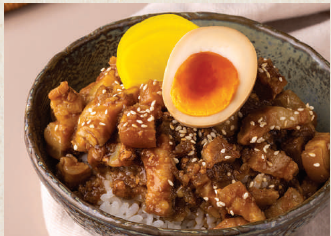
招牌魯肉飯 Signature Lu Rou Fan