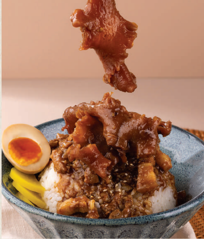
讚 花膠魯肉飯 65頭 Fish Maw Lu Rou Fan