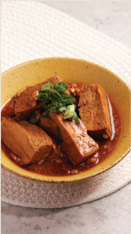
讚 麻婆臭豆腐 68 Ma Po Stinky Tofu