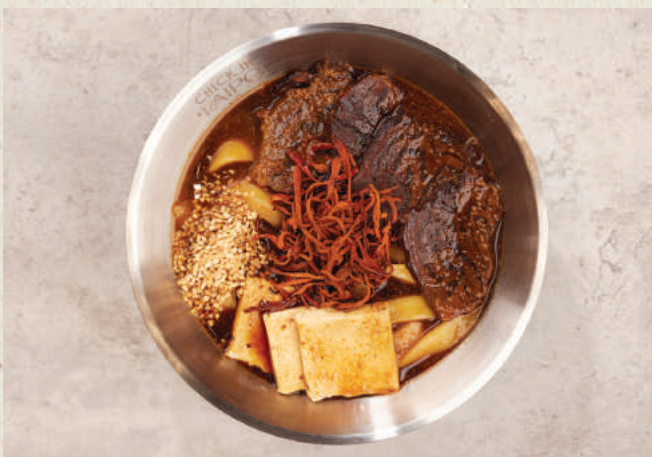
讚 擔擔牛肉麵 Dan Dan Beef Noodles