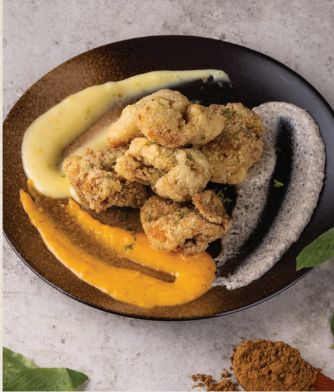
三色鹽酥雞 柚子|松露|冬蔭功 128 Signature Crispy Chicken