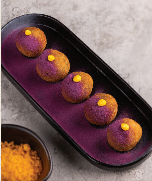
讚 鹹蛋黃芋泥球 Salted Egg Yolk Taro Balls