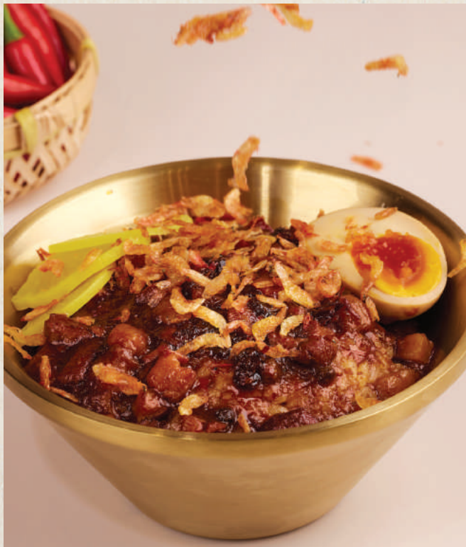
讚 櫻花蝦麻辣魯肉飯 Ma La Lu Rou Fan