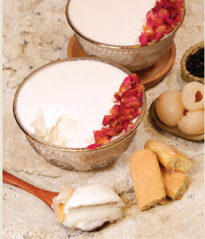
荔枝玫瑰提拉米蘇 麻糬 Lychee Rose Mochi Tiramisu