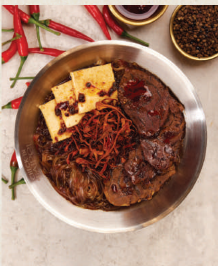
讚 麻辣牛肉麵 128 Ma La Spicy Beef Noodles