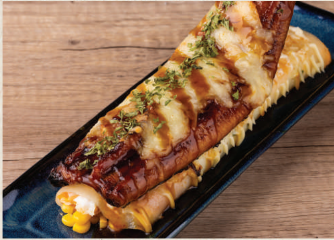
讚 鰻魚起司玉米蛋餅 原條火焰 188 Aburi Japanese Eel Cheesy Egg Crepe