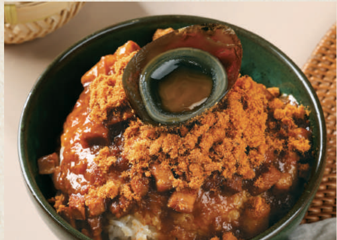
讚 肉鬆皮蛋魯肉飯 Century Egg Pork Floss Lu Rou Fan