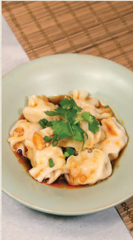
酸辣手工餃 75 Sour & Spicy Dumplings