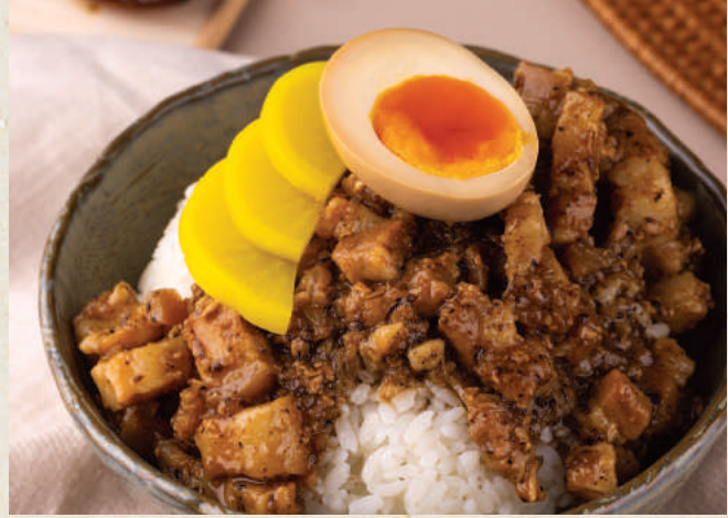
松露魯肉飯 Truffle Lu Rou Fan