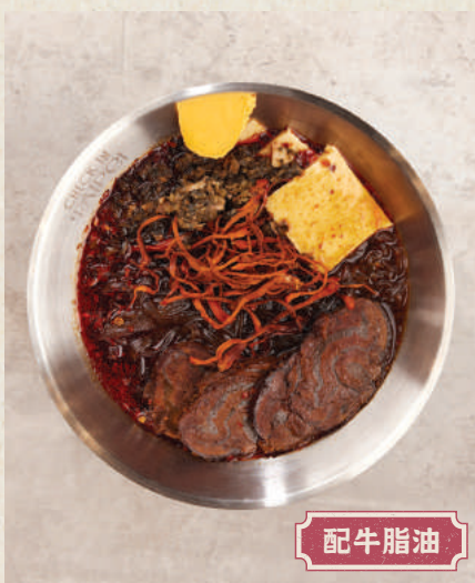
酸辣牛肉麵 118 Sour & Spicy Beef Noodles