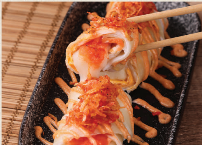
讚 明太子麻糬蛋餅 98 Mentaiko Mochi Egg Crepe