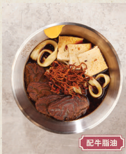
讚 招牌牛肉麵 108 Signature Beef Noodles