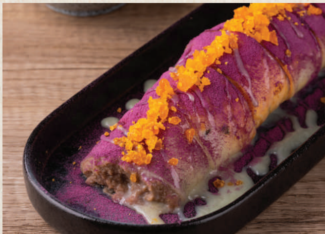
讚 髒髒鹹蛋黃芋泥蛋餅 88 Salted Egg Yolk Taro Egg Crepe