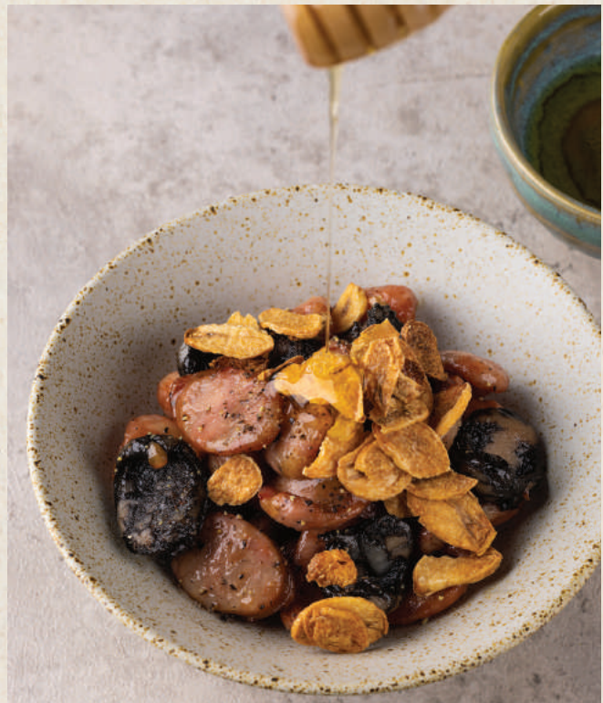
蒜香三色台腸 75 Tri-colour Taiwanese Sausages