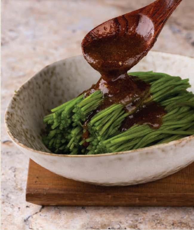
蒜泥台灣水蓮 98 Garlic Taiwanese Water Lotus