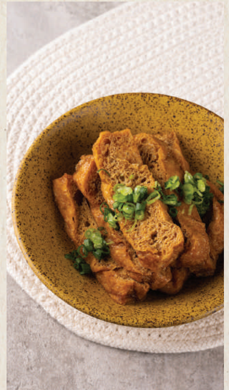
牛汁滷蘭花干 58 Marinated Tofu Skin