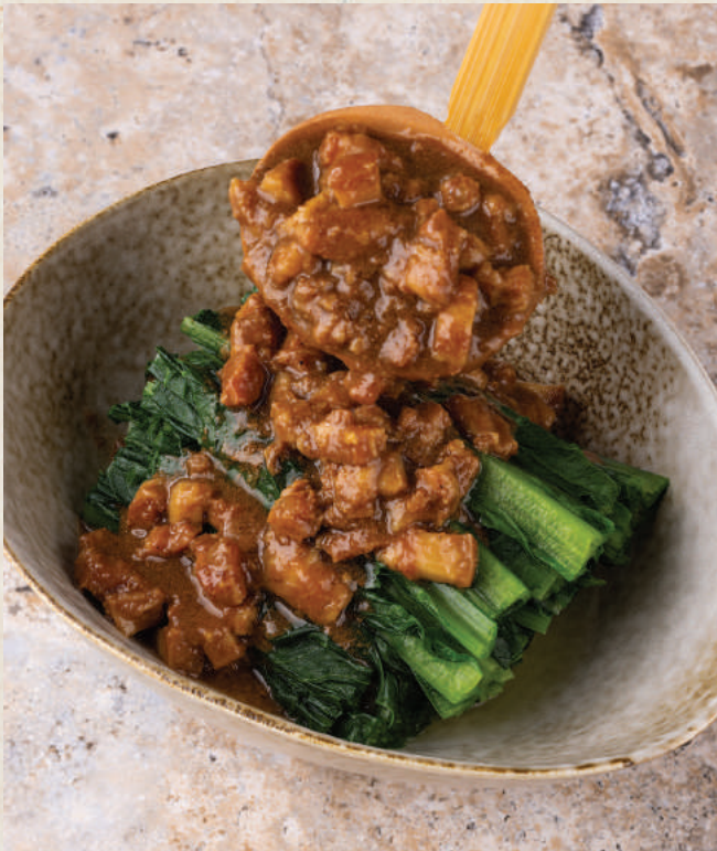
魯肉拌台灣A菜 88 Lu Rou Taiwanese Lettuce