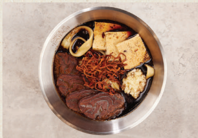
黑蒜牛肉麵 Black Garlic Beef Noodles