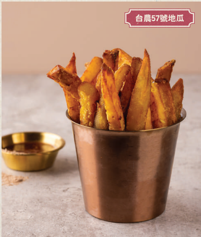
脆皮地瓜條 話梅酸甜醬 68 Sweet Potato Fries