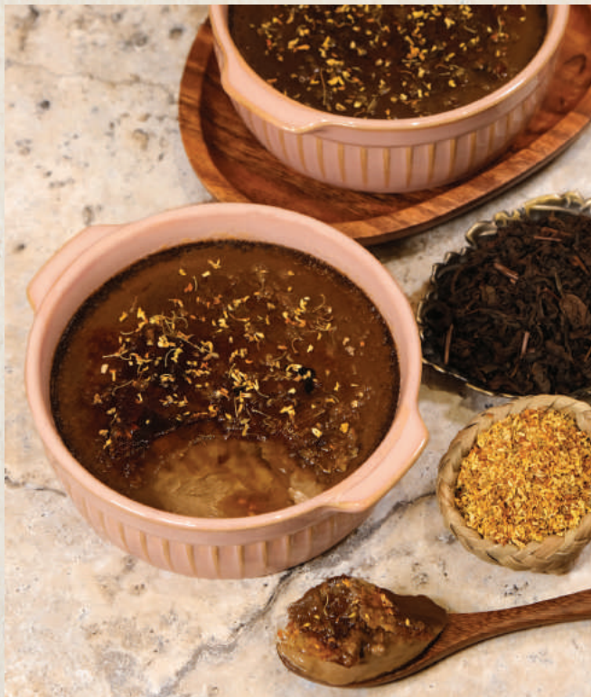
桂花紅茶法式燉蛋 阿薩姆紅茶 Osmanthus Black Tea Crème Brûlée