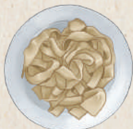
手工刀削麵 Knife Cut Noodles