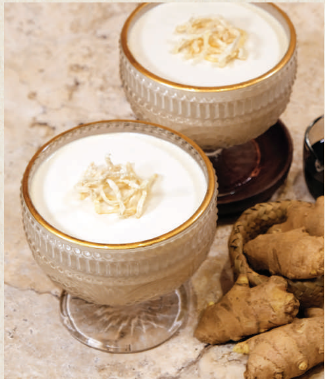
黑糖薑母義式奶凍 Black Sugar Ginger Panna Cotta