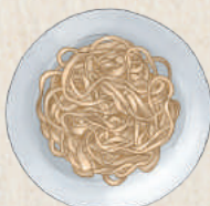
台灣寬粉絲 Bean Noodles