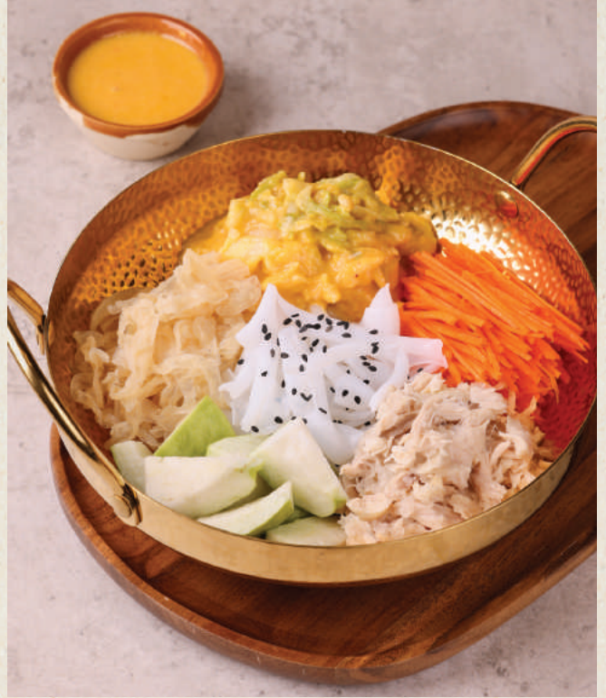
讚 黃金鹽水雞芭樂撈粉皮 128 Golden Salty Chicken Salad