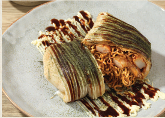
讚 海鮮炒王子麵蛋餅 128 Seafood Stir Fry Noodles Egg Crepe