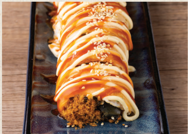
肉鬆皮蛋蛋餅 82 Century Egg Pork Floss Egg Crepe