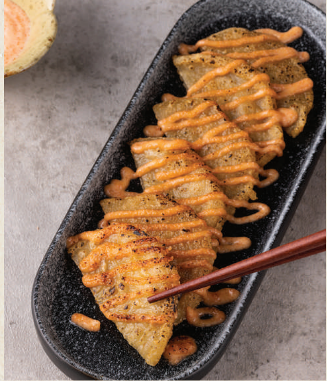
明太子甜不辣 78 Mentaiko Fish Cakes