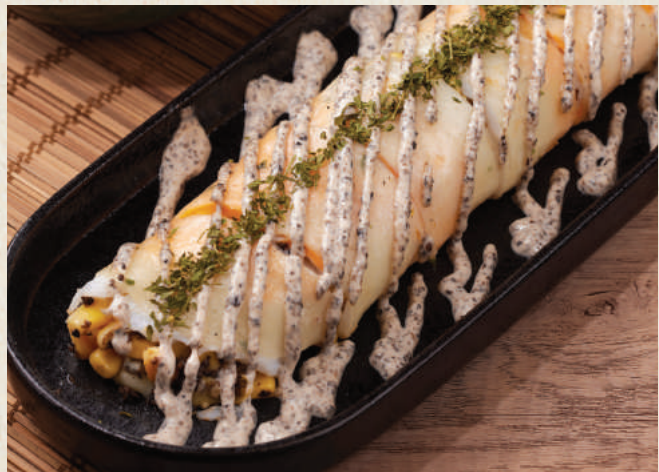
松露起司玉米蛋餅 98 Truffle Cheesy Corn Egg Crepe